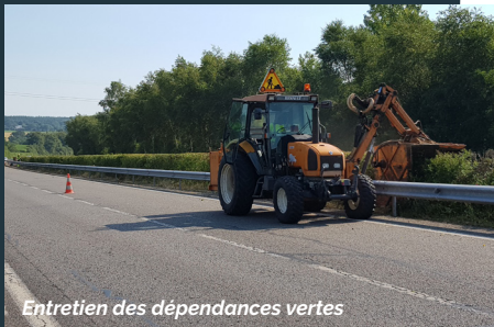
Entretien des dépendances vertes

Faciliter vos déplacements au quotidien et pour demain