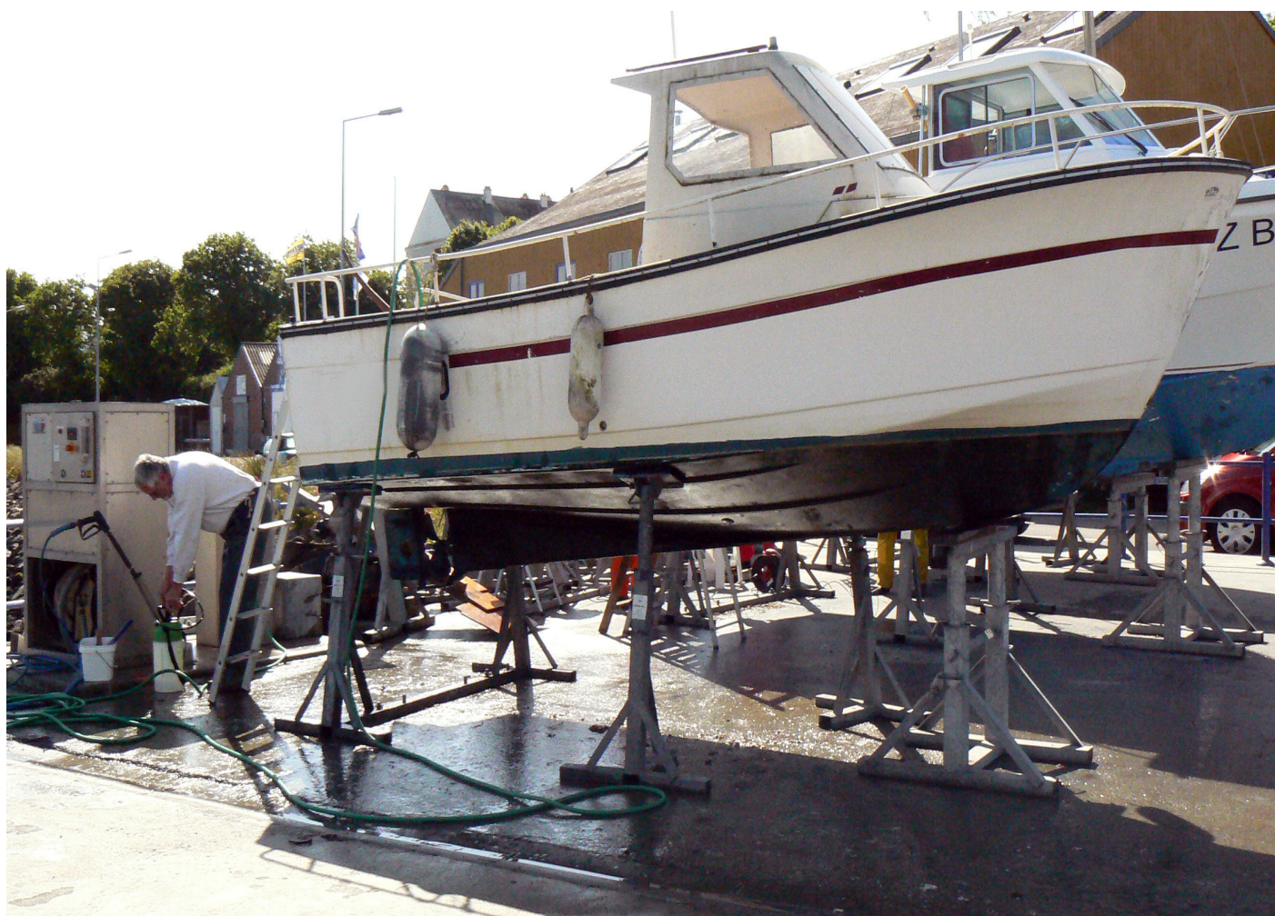
Opération de carénage dans le port de Tréboul, Douarnenez

Le carénage sauvage est passible d'amendes de 150 € à 1500 € pour les contraventions de 2 ème à 5 ème classe (R541-76 et R212-48 du code de l'environnement, L2132-3 Code général de la propriété des personnes publiques) et jusqu'à 2 ans d'emprisonnement et 75 000 € d'amende (L216-6 code de l'environnement).