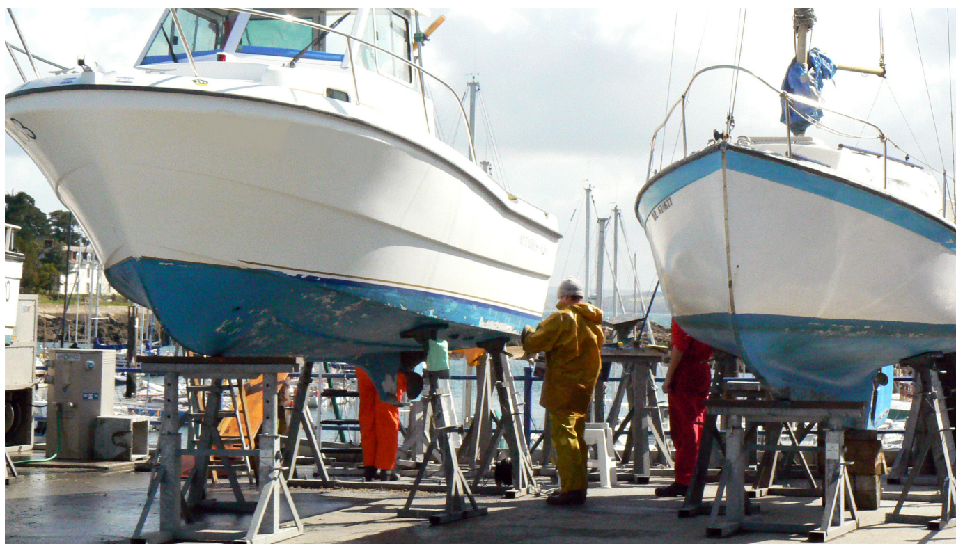
Opération de carénage dans le port de Tréboul, Douarnenez