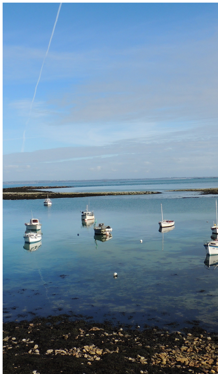
Ile de Molène

2.616 permis côtiers et 162 permis hauturiers délivrés en 2017 dans le département